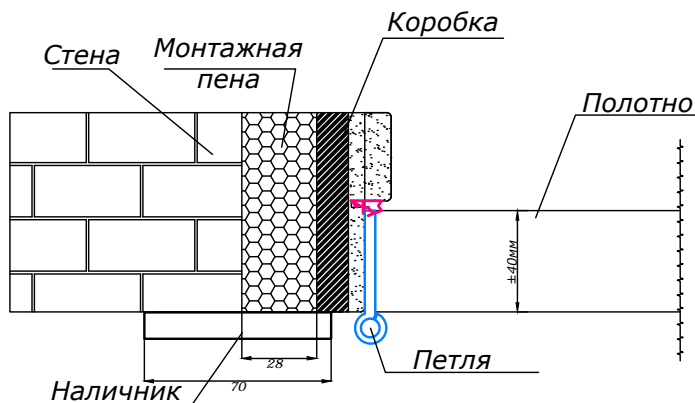
Размеры распашных дверей деревянная коробка для 2-х створчатой двери наличник 70мм